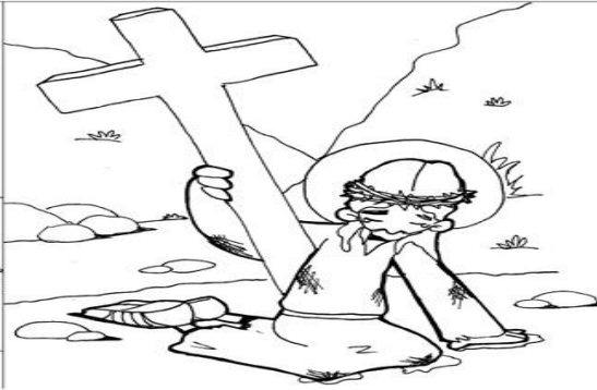
7º ESTACIÓN: JESÚS CAE POR SEGUNDA VEZ