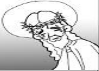
1º ESTACIÓN: JESÚS ES CONDENADO