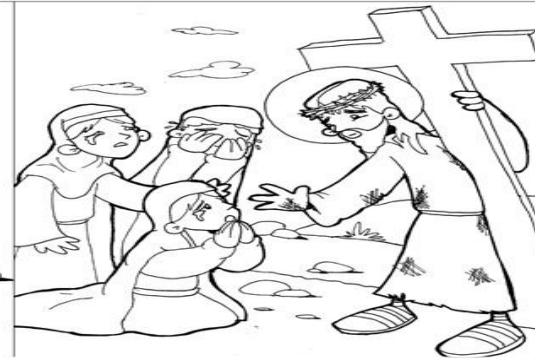
8º ESTACIÓN: JESÚS CONSUELA A LAS MUJERES DE JERUSALÉN