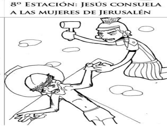
11º ESTACIÓN: JESÚS ES CLAVADO EN LA CRUZ