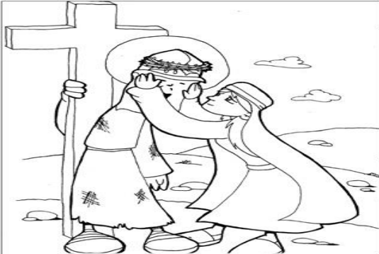
6º ESTACIÓN: LA VERÓNICA ENJUGA EL ROSTRO DE JESÚS