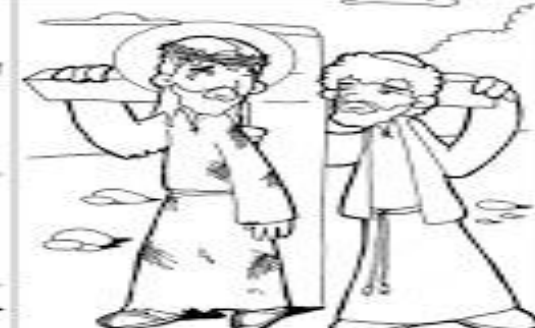
5º ESTACIÓN: EL CIRENEO AYUDA A JESÚS A CARGAR LA CRUZ