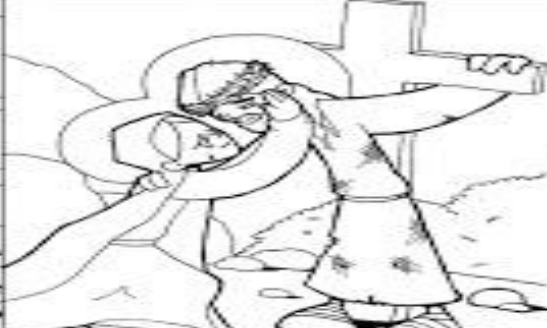
4º ESTACIÓN: JESÚS SE ENCUENTRA CON SU MADRE